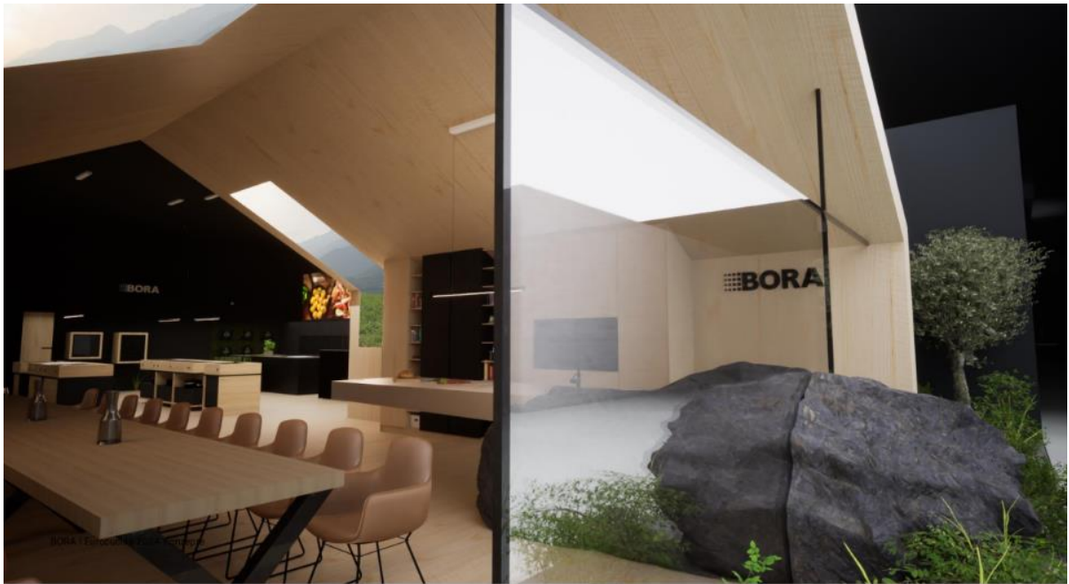
Fusione tra architettura, design della cucina e natura. BORA presenta la sua visione dell'abitare e della cucina contemporanea a EuroCucina.

Con i suoi sistemi di aspirazione per piano cottura BORA ha segnato la fine delle cappe aspiranti, rivoluzionando l'esperienza in cucina. Ora, all'insegna del claim "More than cooking", l'azienda austro-tedesca si spinge oltre con una gamma completa di elettrodomestici da incasso innovativi e di alta qualità per una cucina concepita come spazio abitativo. Dai sistemi di aspirazione per piano cottura BORA al forno a vapore BORA X BO fino ai sistemi di refrigerazione e congelamento (BORA Cool and Freeze), all'illuminazione (BORA Horizon e BORA Stars) all'apparecchio per sottovuoto (BORA QVac), l'obiettivo è quello di fornire un concetto di cucina olistico con prodotti complementari dagli elevati standard di design. Con i prodotti BORA ora è possibile cucinare, cuocere al forno, arrostiti, cuocere al vapore, marinare, mettere sottovuoto e conservare. L'impegno di BORA per offrire una gamma di prodotti dalle prestazioni e dal design eccezionali trasforma le cucine da ambienti puramente funzionali a veri e propri spazi abitativi.