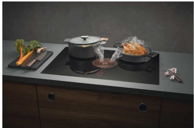
Eine Klasse für sich – und jede Küche

Ein weiteres, funktionales Highlight ist die automatische Abzugssteuerung: Die Leistung des Abzugs regelt sich automatisch anhand des aktuellen Kochverhaltens. So bleibt mehr Zeit zum Kochen, ein ständiges manuelles Eingreifen in die Lüftungssteuerung ist unnötig.