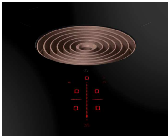
BORA Pure: die in sechs Farben erhältliche Einströmdüse als Eye-Catcher

Reduziert auf das Wesentliche besticht ein prägnantes Gestaltungselement: Mit der aus sechs Farben wählbaren Einströmdüse kann der Konsument selbst kreativ werden. Mit dem eindrucksvollen Eye-Catcher in der Mitte setzt er individuelle Akzente in seinem Zuhause. Persönliche Vorlieben lassen sich so in jedes Küchenambiente integrieren.