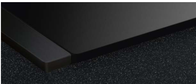
USL5 15AB BORA Listelli laterali per piano cottura con profondità di 515 mm All Black