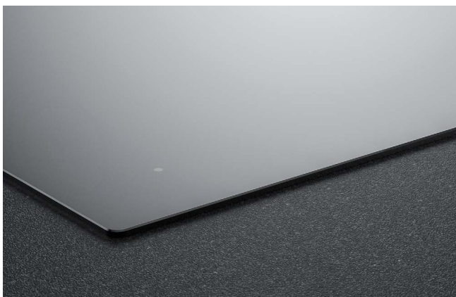
Montaggio in battuta