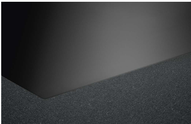
Montaggio a filo piano

Montaggio a filo piano / montaggio in battuta