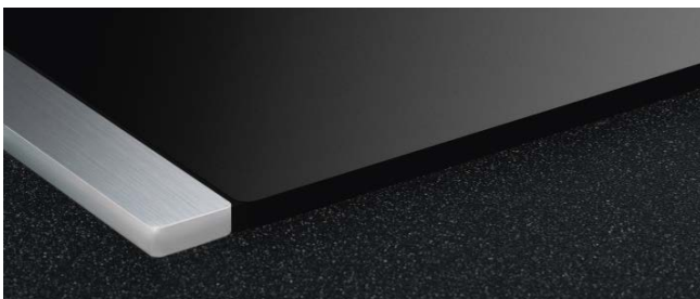
USL5 15 BORA Listelli laterali per piano cottura con profondità di 515 mm