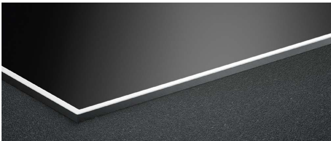
BKR830 BORA Cornice per piano cottura larghezza 830 mm